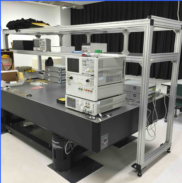
施工例: キャスタータイプ