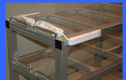
サービスコンセント (オプション)