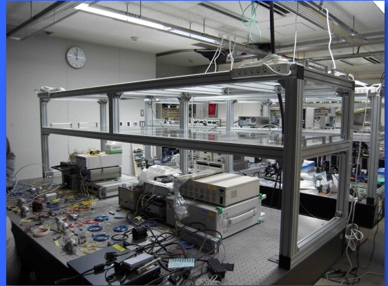
施工例: ベンチトップタイプ