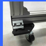
ストッパー付き キャスター